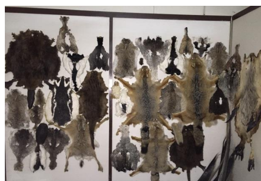
Cueros de animales australes