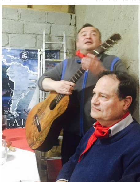
Canturreo festivo en honor a Chiloé