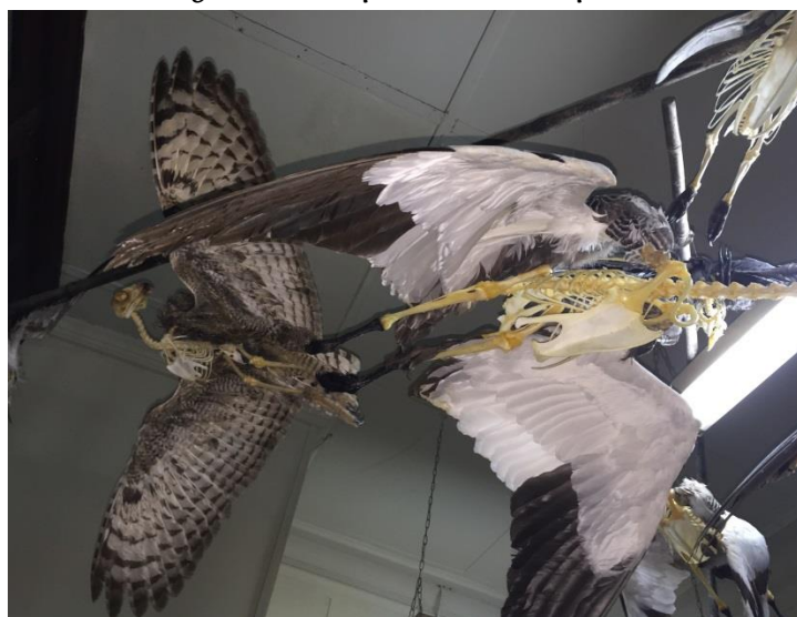
Esqueletos de aves australes