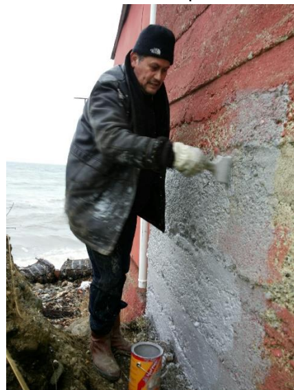
H. Kronos en proceso de impermeabilización