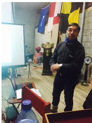
Trazado de rumbo