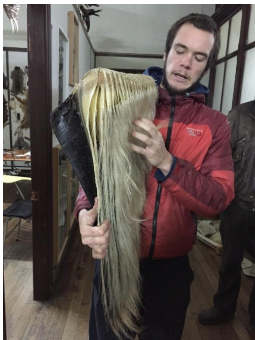
Trozo de barba de ballena