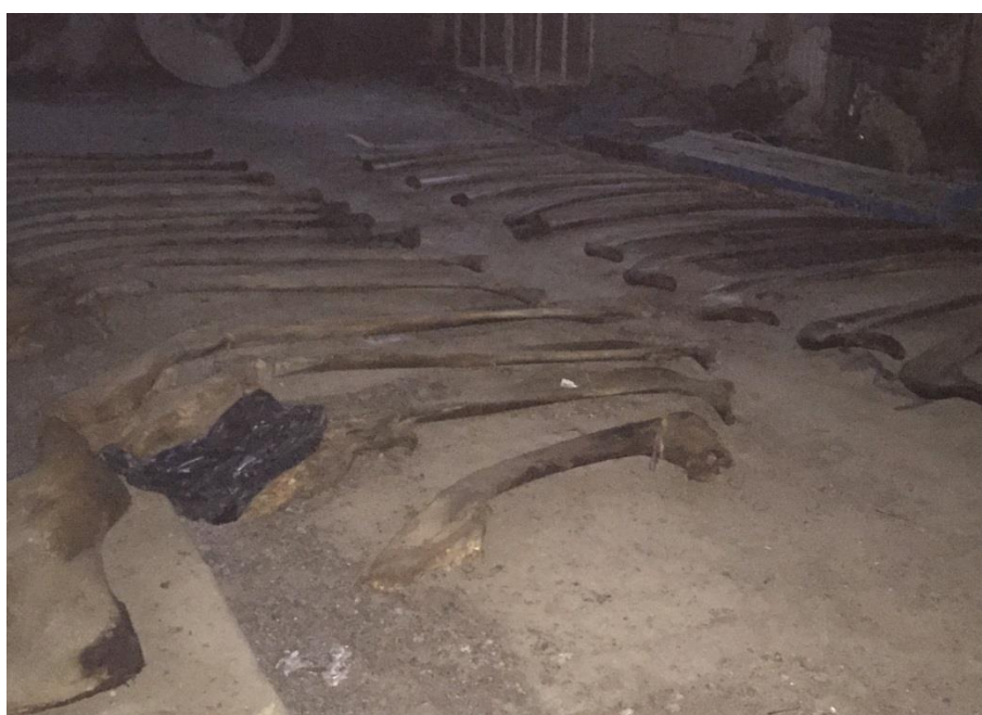
Esqueleto de ballena (rorcual boreal) en etapa de reconstrucción, rescatado de Bahía Inútil (Tierra del Fuego) luego de su varazón en 2014.-