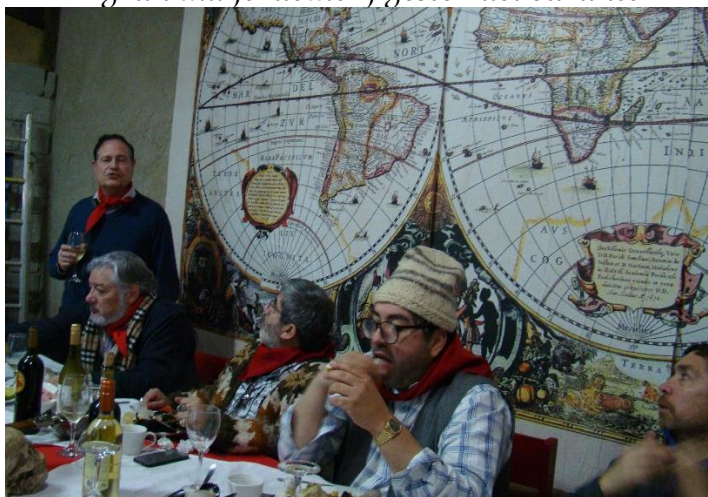
Orzas por la fraternidad