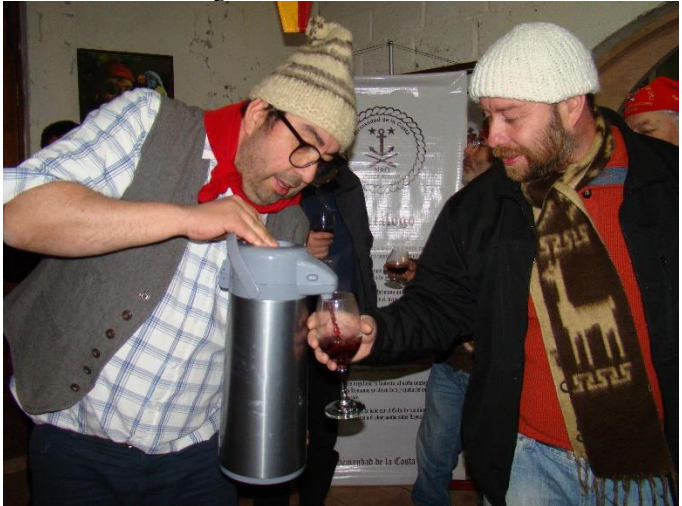
Brebaje finlandés preparado por cautiva de Hermano Canario