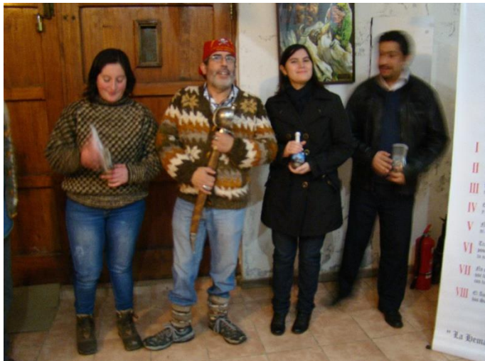
entregando botellas de salvamento