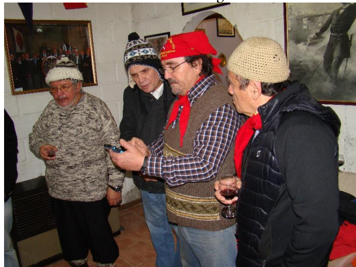
Hermano Bo Pescador narra las hazañas del Asalto a los Fuertes de Chiloé