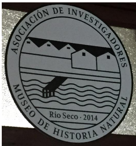
Logo de Asociación