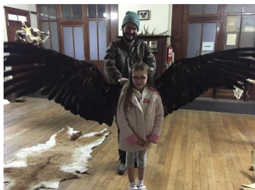
Alas de cóndor