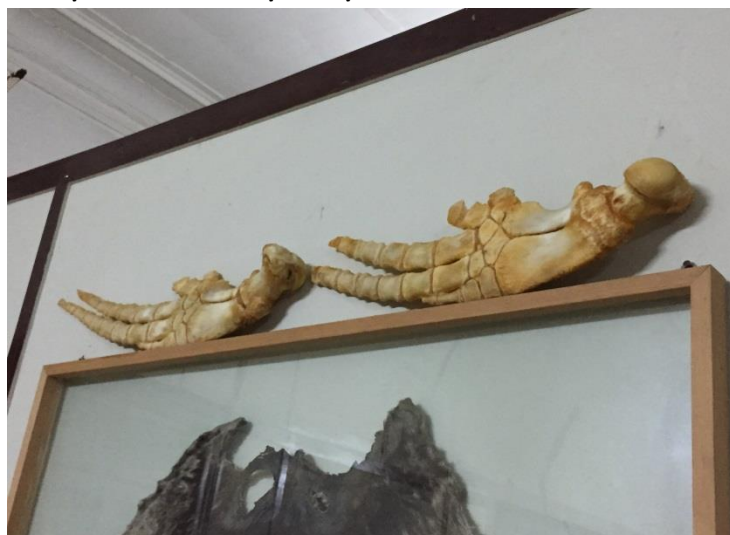
Piezas de especies recuperadas