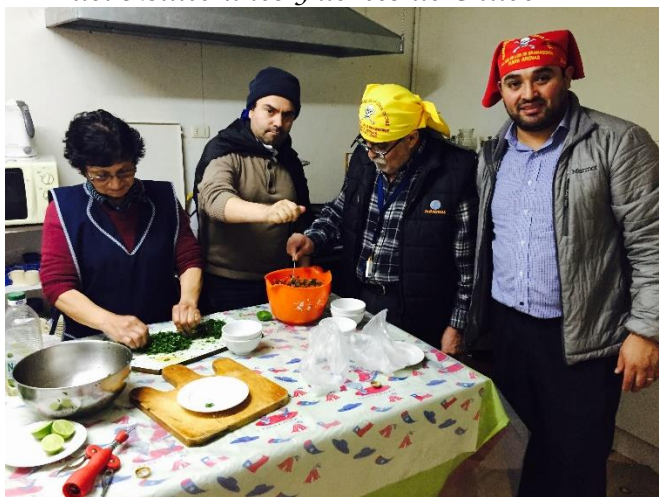
La Sala de Máquinas en pleno