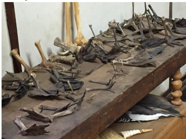
Variedades de Patas de aves