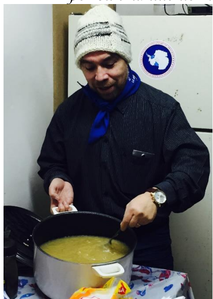
La mazamorra de la Suegra de Chuck