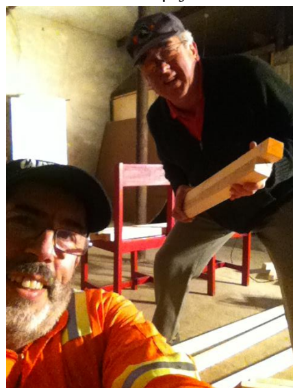
Comienzo de entablado piso con H. Tiburón VI