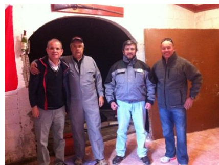
Piquete de despeje inicial

Además, se ha puesto en conocimiento de la tripulación el libro de la Nao Punta Arenas, la que se ha aprobado y ordenado confeccionar, como material de promoción de las acciones piratezcas e históricas de nuestra hermandad y de sus integrantes.