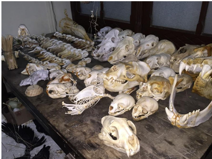
Cráneos de diversas especies