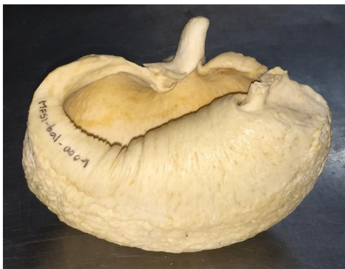
Caja de oído de ballena