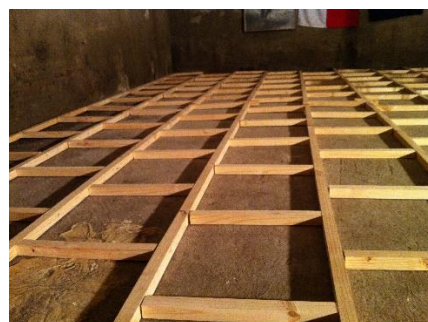
Avances del piso