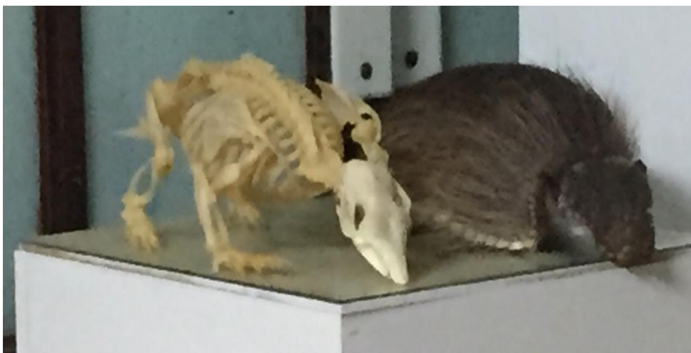
Esqueleto de quinchín