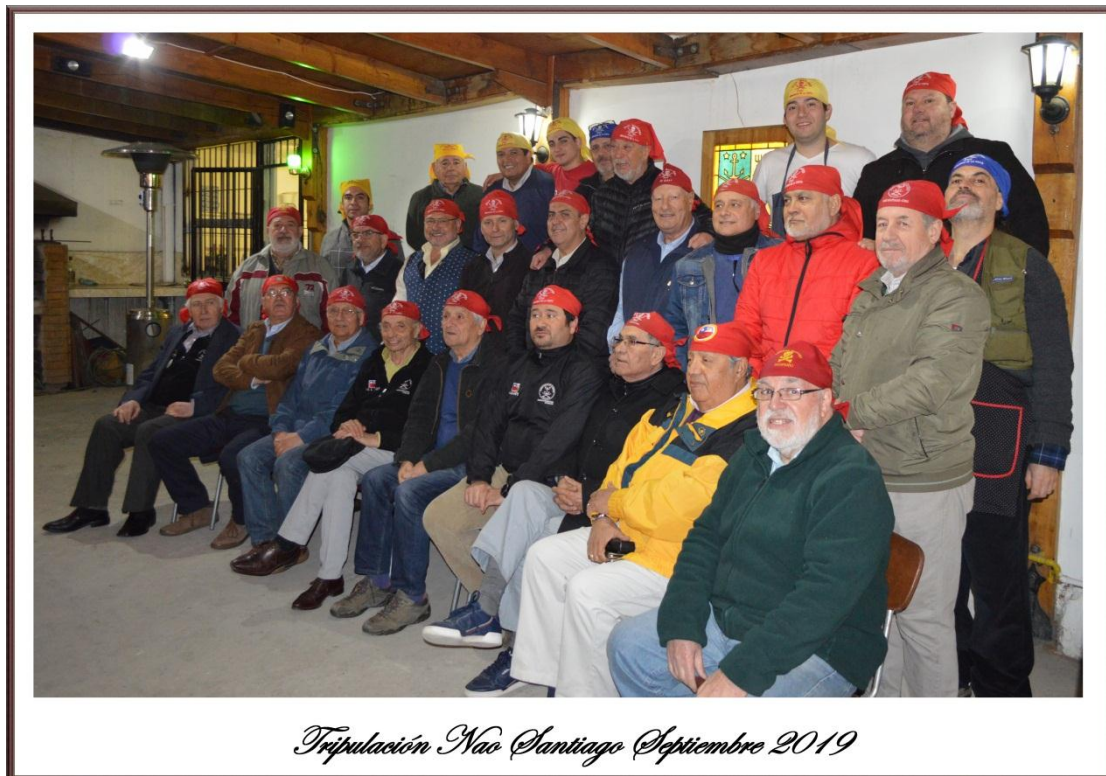
Tripulación Nao Santiago Septiembre 2019

Primera fila: Le Gascogne, Tiburón Blanco, Avispón Verde, Tano, Zalagarda, Capitán Algarete, Vulcano, Cormorán y Germano; Segunda fila: Lula, Mecha Corta, Deutsche Pulpo, Puelche, Campeador, Euzkaro, Toscano, Jack y Argos; Tercera fila: bichi Miguel, bichi Millalobo (Algarrobo), bichi Eugenio, bichi Bruno, Psycho, Pingüino Camanchaca, bichi Ian, Remolcador y Escultor.