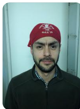
SEÑALERO SEPTIEMBRE 21

Dedicamos un saludo quiebra costilla, pleno de mar, a los Hermanos AZAM y SEÑALERO, que durante el mes de septiembre han comenzado una nueva singladura. Viento a un largo y mucha agua bajo la quilla. Orza!!