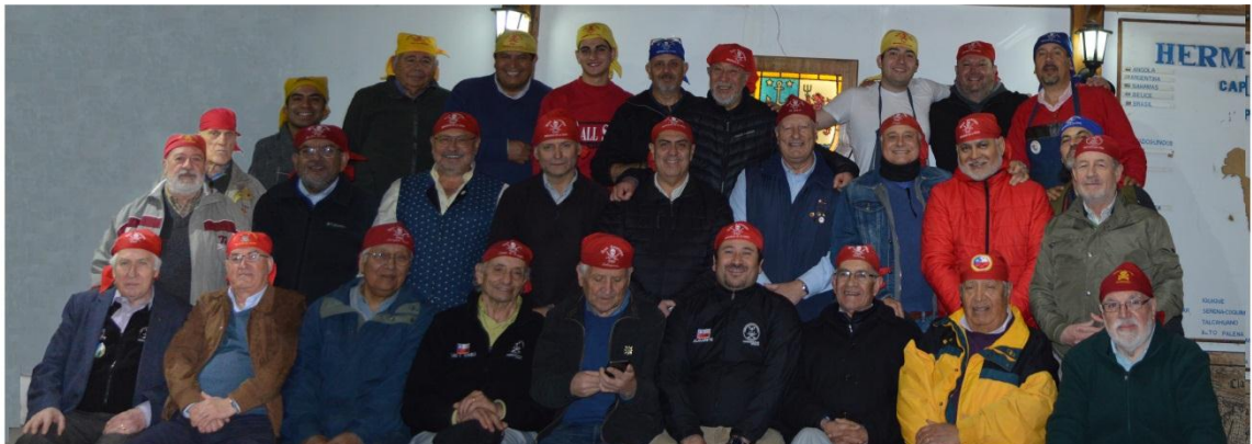
Trípulación Nao Santiago Septiembre 2019